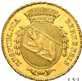
3167 Doppelduplone 1795, Bern. 15.21 g. D.T. 499c. HMZ 2-211d. Fr. 181. Vorzüglich-FDC / About Uncirculated. (~€ 1'650/USD 1'925) 1'500.-