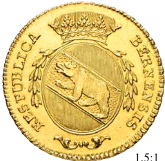
3166 Doppelduplone 1793, Bern. 15.19 g. D.T. 499a. HMZ 2-211a. Fr. 181. Auf dem Revers überarbeitet / Overworked on the reverse. Gutes vorzüglich / About Uncirculated. (~€ 1'540/USD 1'795) 1'400.-